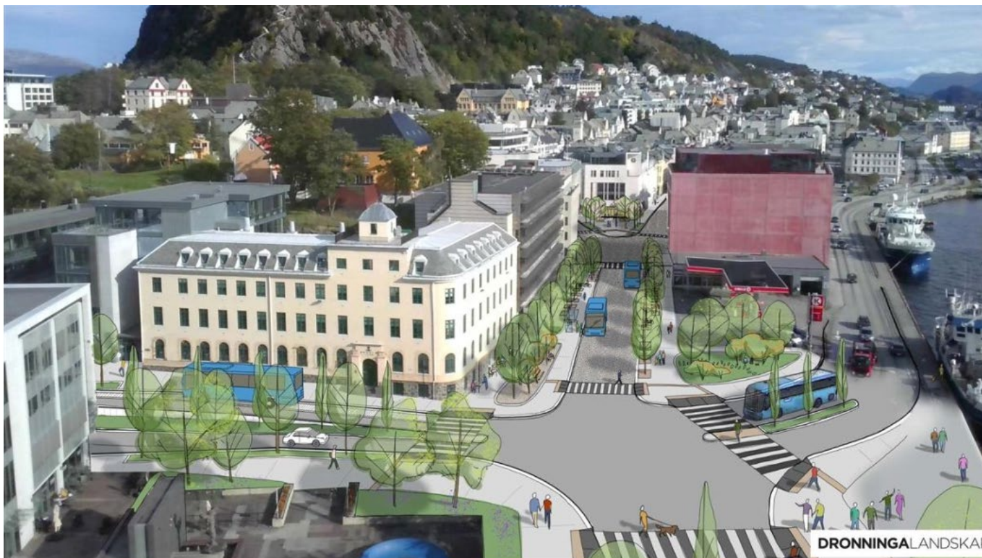
Illustrasjon som viser det nye kollektivknutepunktet i Ålesund sentrum